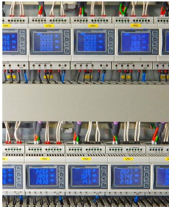
Stromzähler im Schaltschrank integriert

Kläranlagen gehören zu den größten Energieverbrauchern einer Kommune. Der Gesamtstrombedarf der rund 10.000 Kläranlagen in Deutschland liegt in einer Größenordnung von 4.200 Gigawattstunden (GWh) pro Jahr (Quelle Deutsche Vereinigung für Wasserwirtschaft, Abwasser und Abfall, DWA 2010). Das entspricht etwa dem Strombedarf von 900.000 Vier-Personen-Haushalten. Dabei ist der Energiebedarf der Kläranlagen nicht nur abhängig von den eingesetzten Reinigungsverfahren und dem Reinigungsziel, sondern auch von den örtlichen Gegebenheiten und der erreichten Energieeffizienz.