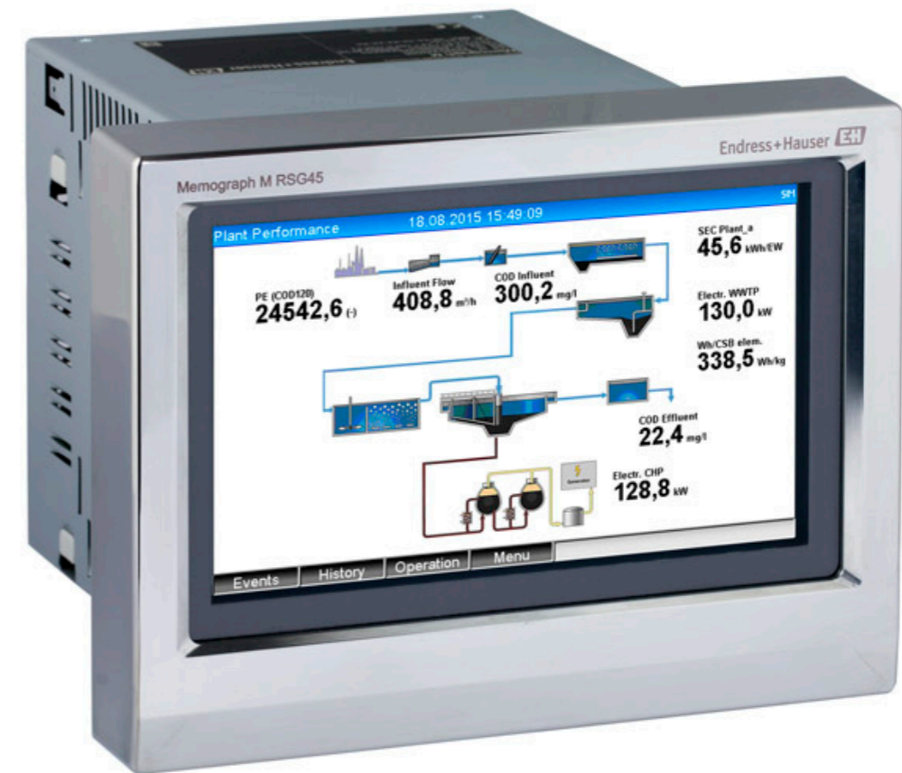
Memograph M RSG40

Genau deshalb hat die Stadt Kandern bereits schon vor zehn Jahren beim Umbau ihrer Kläranlage damit begonnen, diese energetisch zu optimieren. Nachdem der Faulbehälter errichtet war, wurde in ein Blockheizkraftwerk (BHKW) investiert, so dass derzeit dem Blockheizkraftwerk (BHKW) täglich